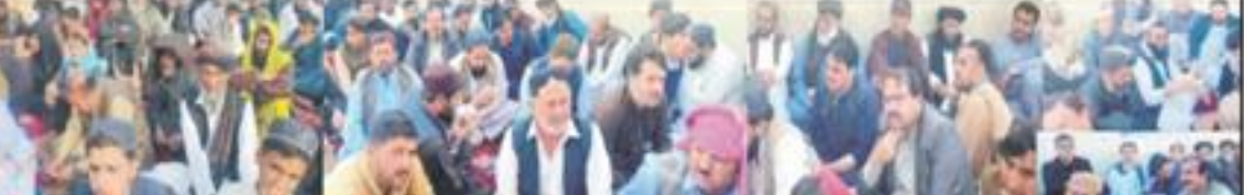
جنگلی فتنوں سے حفاظت قرآنی احکامات کی پیروی میں ہے مولانا یوسف...