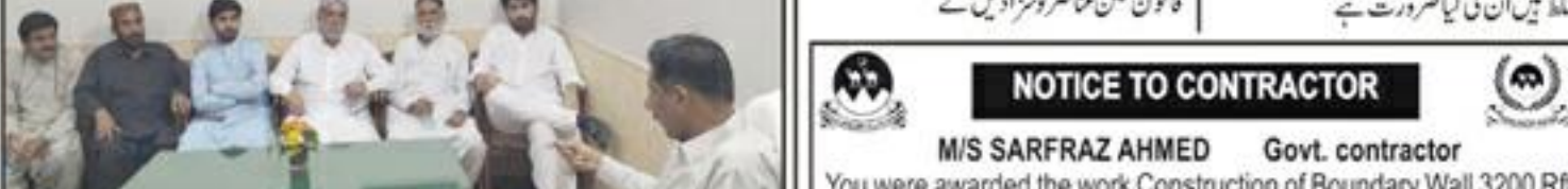
نیشنل ایس ایف ایف میں اسٹریٹ ریڈنگ اور لٹریچر...

روٹی میں کتے لڑانے والے مالکان اور تلوں کو حراست میں لے لیا...