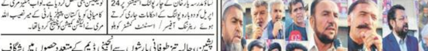
نواب خلیفہ مری کی کامیابی کو نصب اللہ مری نے اپنی نشست میں جیت لیا...