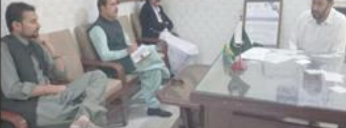
پنجاب کی سرکار نے بلوچستان کی ترقی کے لیے ایک نیا منصوبہ پیش کیا

پنجاب کی سرکار نے بلوچستان کی ترقی کے لیے ایک نیا منصوبہ پیش کیا، اس بارے میں خبر۔ پنجاب کی سرکار نے بلوچستان کی ترقی کے لیے ایک نیا منصوبہ پیش کیا، اس بارے میں خبر۔ پنجاب کی سرکار نے بلوچستان کی ترقی کے لیے ایک نیا منصوبہ پیش کیا، اس بارے میں خبر۔