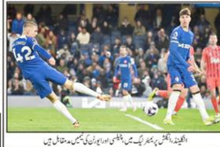
انگلش ریگریٹ کی ٹیم کے کپتان ایئر سٹار کے گول کی تصاویر

لیگ کے بیچ میں ایئر سٹار کی ٹیم کو با آسانی 6-0 گول سے ہرا دیا، یہ چیلنجی کی ٹیم کی ای ایل بی میں 13 ویں فتح ہے۔ چیلنجی کی انگلش ریگریٹ لیگ میں 13 ویں فتح ہے اور وہ 47 پوائنٹس کے ساتھ لیگ پر فوٹو پوزیشن پر ہے۔ انگلش ریگریٹ کی ٹیم کو با آسانی 6-0 گول سے ہرا دیا، یہ چیلنجی کی ٹیم کی ای ایل بی میں 13 ویں فتح ہے اور وہ 47 پوائنٹس کے ساتھ لیگ پر فوٹو پوزیشن پر ہے۔ ایئر سٹار کی ٹیم نے 13 ویں فتح ہے اور وہ 47 پوائنٹس کے ساتھ لیگ پر فوٹو پوزیشن پر ہے۔