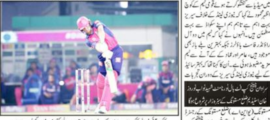
پندرہویں لیڈنگ ٹیم کے لیے عالمی کرکٹ کا افتتاحی ٹورنامنٹ

پندرہویں لیڈنگ ٹیم کے لیے عالمی کرکٹ کا افتتاحی ٹورنامنٹ، جس میں پاکستان اور دیگر ممالک نے حصہ لیا، کوئیٹہ میں منعقد کیا گیا۔ پندرہویں لیڈنگ ٹیم کے لیے عالمی کرکٹ کا افتتاحی ٹورنامنٹ، جس میں پاکستان اور دیگر ممالک نے حصہ لیا، کوئیٹہ میں منعقد کیا گیا۔ پندرہویں لیڈنگ ٹیم کے لیے عالمی کرکٹ کا افتتاحی ٹورنامنٹ، جس میں پاکستان اور دیگر ممالک نے حصہ لیا، کوئیٹہ میں منعقد کیا گیا۔